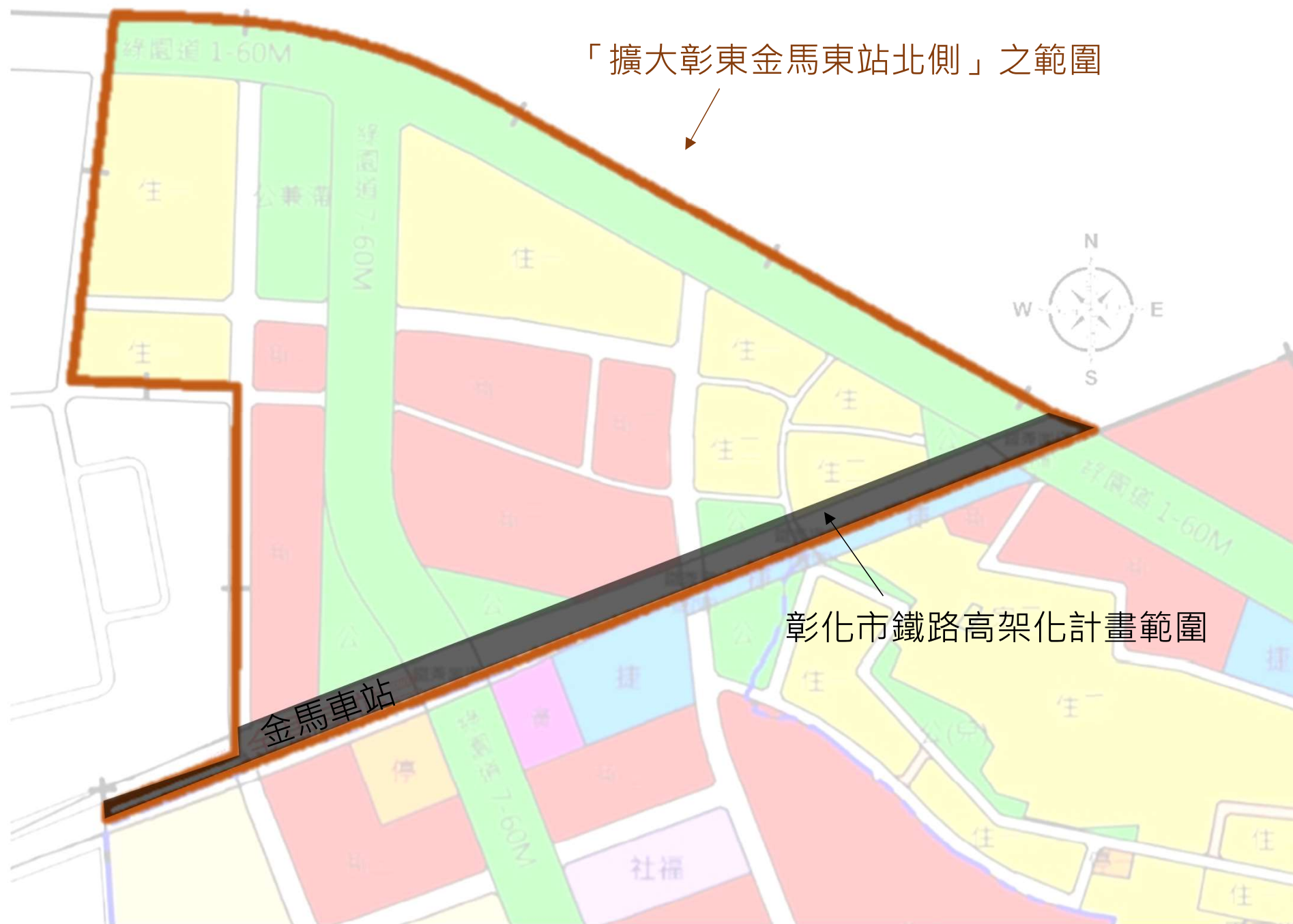
彰化市鐵路高架化計畫與「擴大彰東金馬車站北側」範圍示意圖