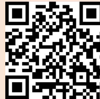
簽約金融機構名冊