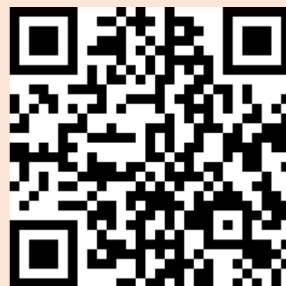
信用保證常見問答

依財團法人中小企業信用保證基金簽約金融機構為準，信用保證常見問答及名冊請詳參下方連結：