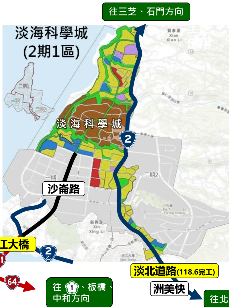
淡海新市鎮聯外道路系統：